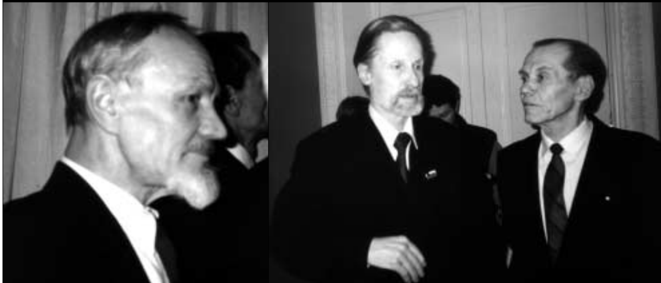
Скульптор А. Добровольский