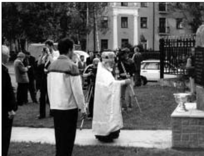
Молебен – освящение памятного знака перед началом митинга у Казанского монастыря 24 июня.