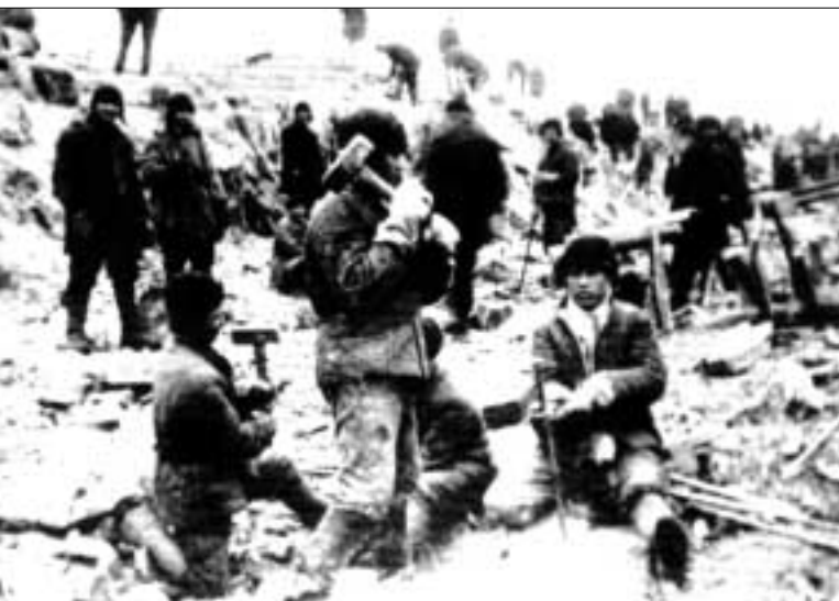
Труд заключенных на Беломорканале. 1932 г.