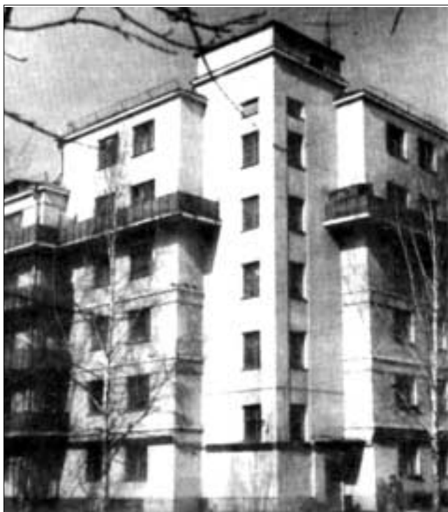
Типичный пример московской городской застройки советского периода - дом на Шаболовке, 1927 г.

На международном семинаре «Создание кондоминиумов и жилищных товариществ в рамках осуществления жилищно-коммунальной реформы» в Москве (июль 1999 г.) было предложено специальное обучение управляющих домами и программа такого обучения. В основу ее был положен принцип согласования всех дисциплин, подчиненных единой цели профессиональной подготовки. Однако до сих пор никаких сдвигов по реализации этого предложения не имеется.