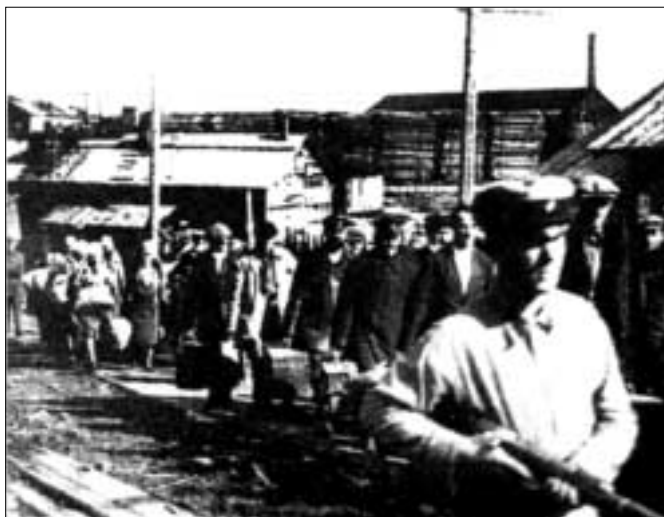
Конвоирование заключенных на теплоход «Глеб Бокий», отплывающий на Соловецкие острова. Кемь, 1937 г.