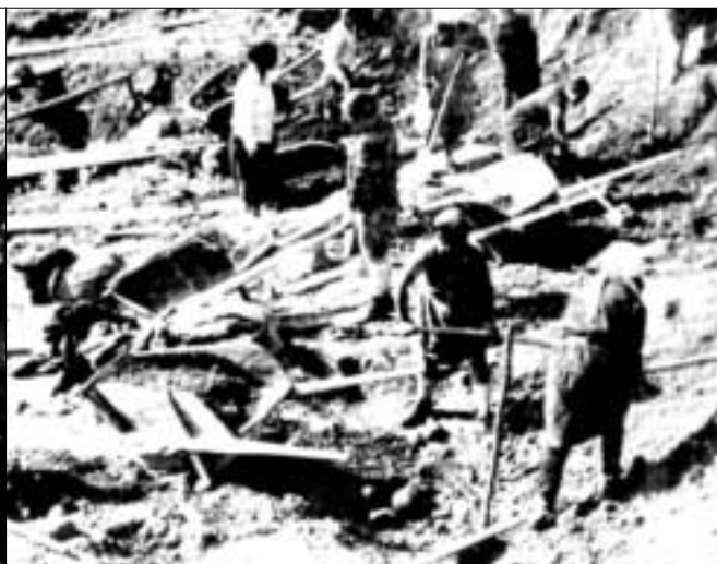
Бригада женщин на Беломорканале. 1932 г.