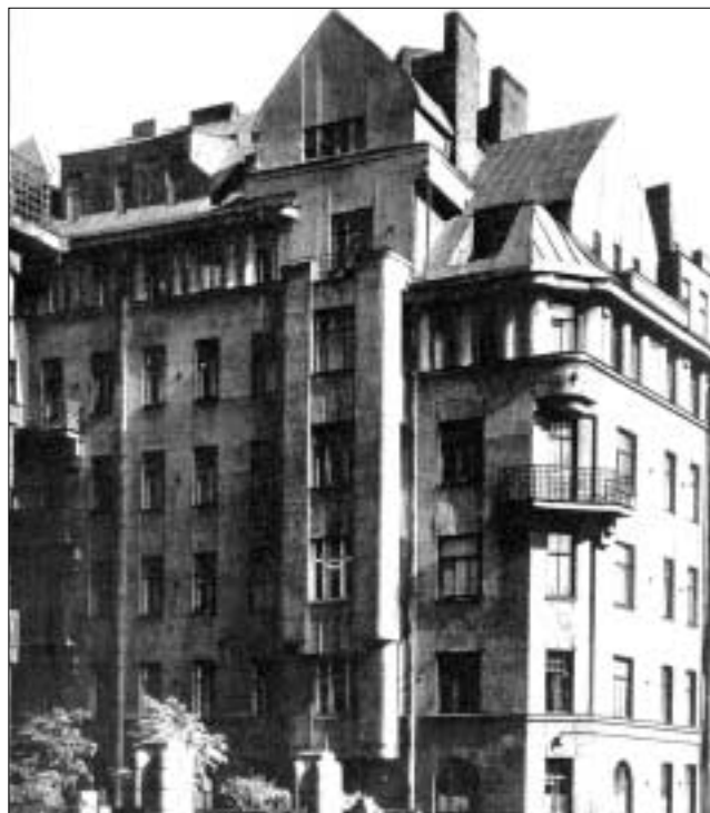
«Предтеча» советского градостроительства – дом Бассейнового товарищества, Санкт-Петербург, 1913 г.

Мы не уверены, что таким же добрым словом поманут наши сограждане инициаторов современных планов «генеральных реконструкций», ограничивающихся на практике вытеснением недорогого жилья и его обитателей из престижных районов на окраины без всякой компенсации. Разговоры о массовых реконструкциях лишь порождают неуверенность, отбивают охоту хоть как-то заботиться о своем жилье, а у части населения, не потерявшей еще иллюзорных надежд, усиливают иждивенческие настроения. Такая политика ведет лишь к увеличению числа «очередников», усугубляя жилищный кризис. Мировой и отечественный опыт приоритета «сохранения жилья» перед новым его строительством в периоды обострения жилищной нужды в современной политике городских властей не признается. Советские традиции массового жилищного строительства продолжают сохранять приоритет в современной практике «реформы жилищно-коммунального хозяйства».