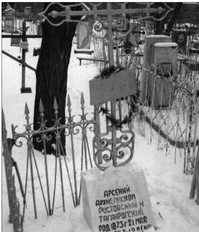
Слева: могила архиепископа Арсения (Смоленца) на старом кладбище г. Таганрога. Справа: Братская могила офицеров и юнкеров убитых и замученных 17-21 января 1918 г., на старом кладбище.