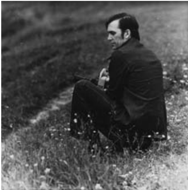
Э. Г. Климов на выборе природы для фильма «Агония». 1973—1975 гг. РГАЛИ. Ф. 3095. Оп. 1. Д. 587. Л 11.