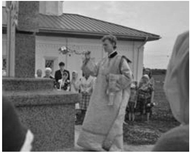
Освящение памятного креста на месте Холмогорского лагеря. Июль 2010 г.