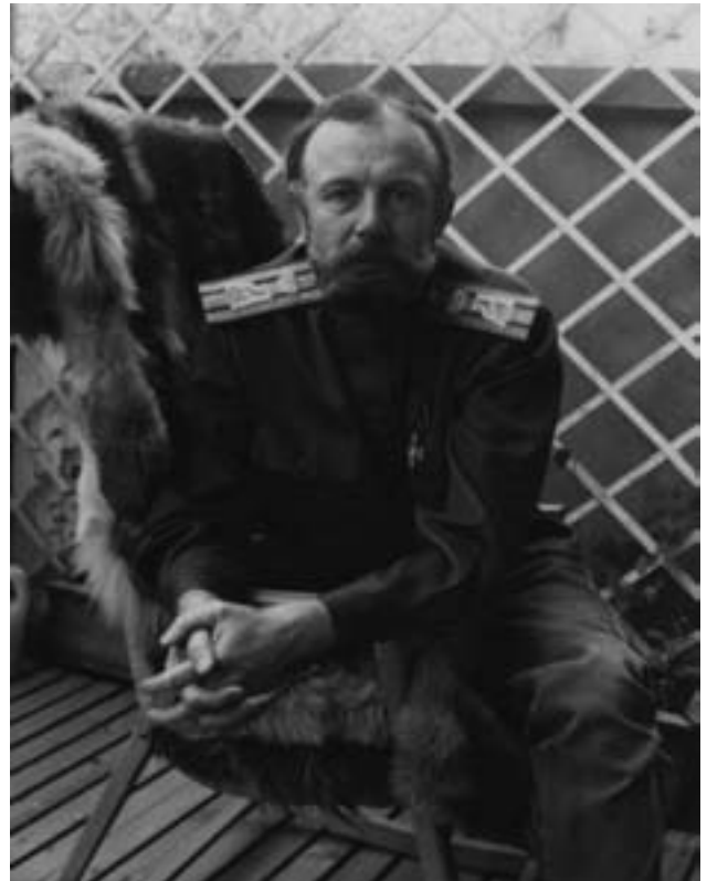
И. М. Смоктуновский на пробах на роль Николая II. 1973 г.