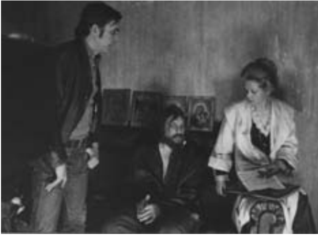
Режиссёр Э. Г. Климов, актёр А. В. Петренко и актриса А. Б. Фрейндлих. 1973–1974 гг. РГАЛИ. Ф. 3095. Оп. 1. Д. 132. Л. 12.

на специфическом лексиконе тех лет. Видно, кому-то где-то кто-то что-то сказал, что-то почему-то кому-то не понравилось, и это было вполне достаточно, чтобы грубо начальственно оборвать работу довольно большого коллектива» [2].