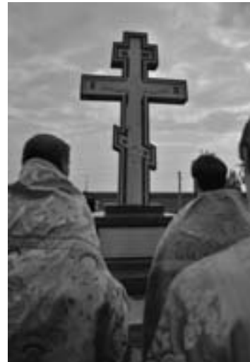
Освящение памятного креста на месте Холмогорского лагеря. Июль 2010 г.

Угрозами и пытками бывшего чекиста пытались заставить признаться в шпионаже и «контрреволюци-