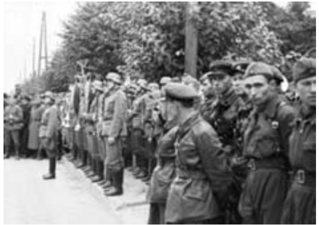
Вермахт и РККА в Бресте. 1939 г.

Знакомые картины 1917–1918 гг. «Изъятие» помещичьих, церковных и монастырских земель. Помещичьи дома обращаются в клубы и школы или в них вселяют батраков с семьями. Скоро придёт и очередь зажиточных крестьян.