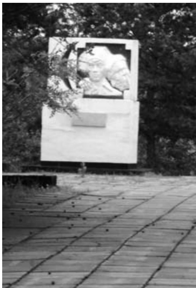
На Бульгинском кладбище в Барнауле