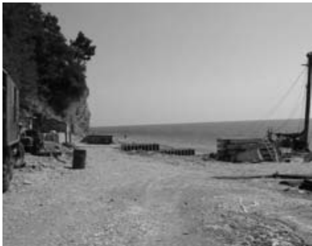
Строительство забора в Прасковеевке

Н а побережье Черного моря в Геленджикском районе возле поселка Прасковеевка вот уже несколько лет ведется стройка. Как удалось выяснить