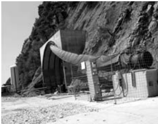
Туннель к даче

из неофициальных источников, строится резиденция правительства, в которую входит несколько современных построек, вертолетная площадка и другие сопутствующие хозяйственные объекты (в народе называемые «дачей В. Путина»). Место,