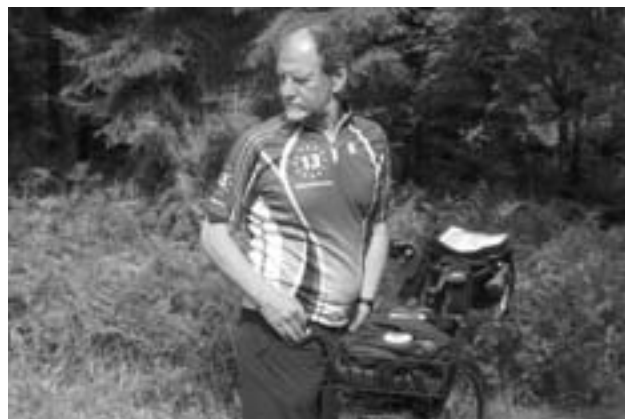
Микаэль Крамер, член Европарламента, активист партии «зеленых», автор идеи велопробега по местам «железного занавеса»

— Не только в Германии, но и в других странах. Были разные организации и инициативы, просто у них