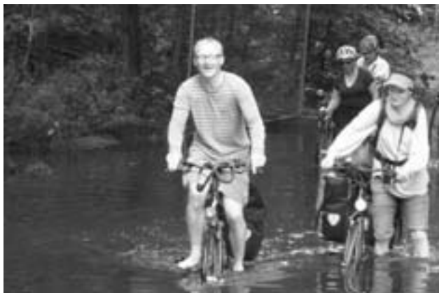
На колесах по Германии

— «Железный занавес» не обязательно всегда соседствовал с опасными объектами. Не везде делали