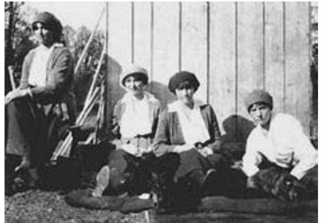
Царская семья под арестом в Александровском дворце