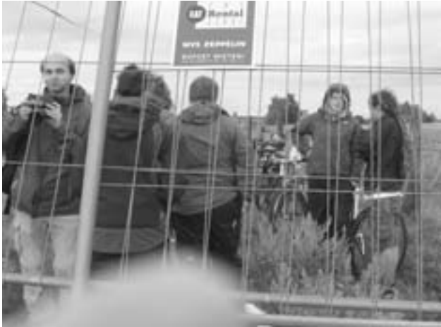
Здесь трубы газопровода Норд Стрим «ступают» на немецкую землю

они готовы забрать эту территорию у федерального правительства.