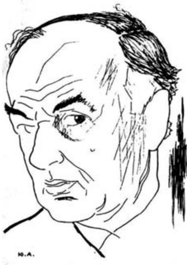
Юрий Анненков. Автопортрет

Во время последней финско-советской войны (когда «широкие круги национально-мыслящей русской эмиграции» неожиданно стали на сторону Советов, неожиданно приняв советский интернационал за российский национализм) я в Париже каждым утром следил по карте Финляндии за наступательным движением советской «освободительной» армии. И вот пришла весть о том, «что Куоккала отошла к Советам». В то утро я был освобождён от тяжести хозяйственных забот (давно уже ставших платоническими). Руины моего дома и полуторадесятинный парк с лужайками, где седобородый Короленко засветил однажды в Рождественскую ночь окутанную снегом ёлку; где, гимназистом, я носился в горелки с Максимом Горьким и моей ручной галкой Матрёшкой, где я играл в крокет с Маяковским; где грызся о судьбах искусства с фантастическим военным доктором